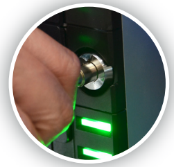
Bloqueos interiores de acceso al efectivo