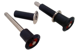
Sistema de anclaje desmontable (opcional)